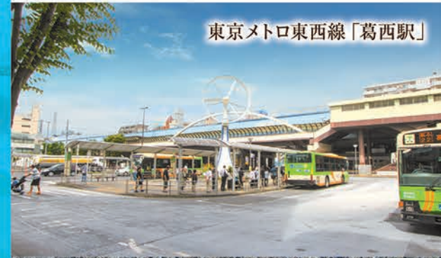
東京メトロ東西線「葛西駅」